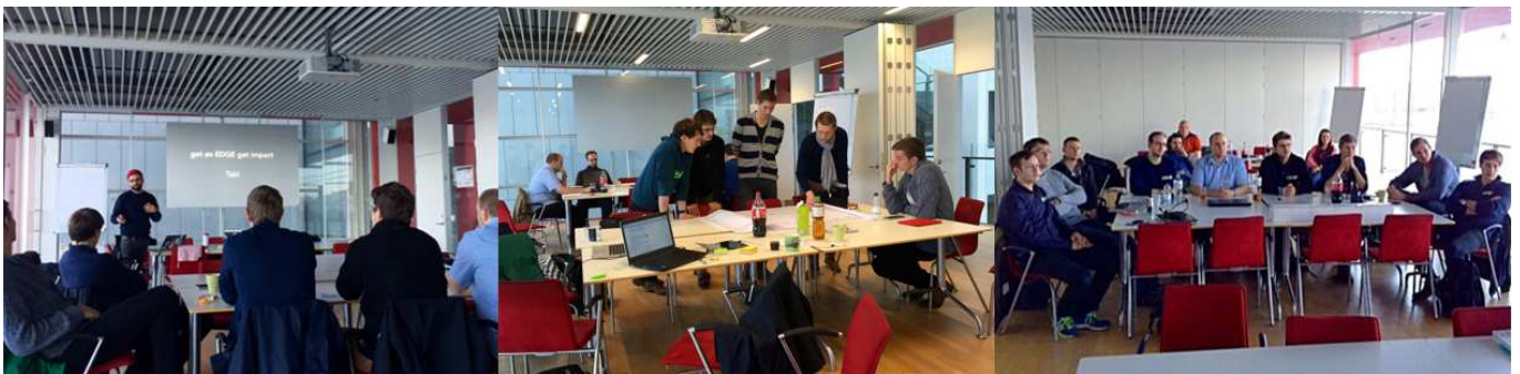
Abbildung 1: Green Entrepreneurship Labs 1 und 2 im Alision

Die Teams hatten die Chance, gemeinsam an den selbst definierten Herausforderungen zu arbeiten und dabei einen tatkräftigen und erfahrenen Praktiker an ihrer Seite zu haben, um weiter am eigenen Geschäftsmodell schrauben zu können.